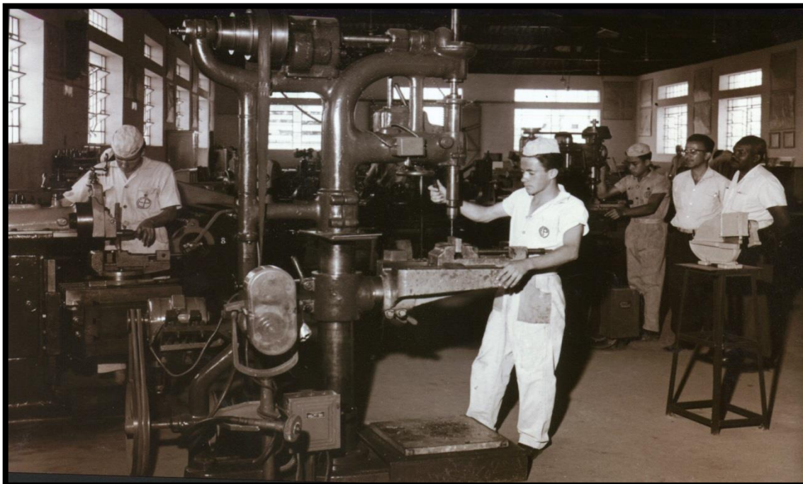
FIGURA 2 – Aprendizes trabalhando nas oficinas da Escola Profissional.