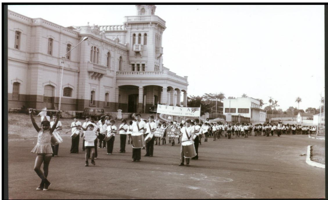
FIGURA 03 – Desfile dos alunos da Escola Primária Carmela Dutra.