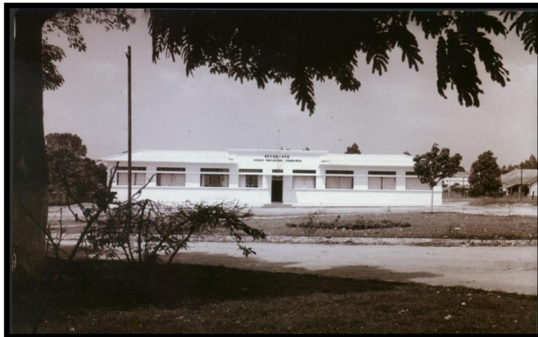
FIGURA 1 – Escola Profissional Ferroviária da Estrada de Ferro Goiás.